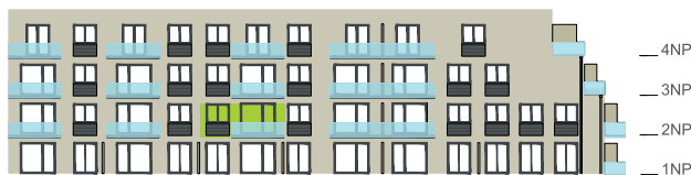
Východní pohled na dům / Building View - east side